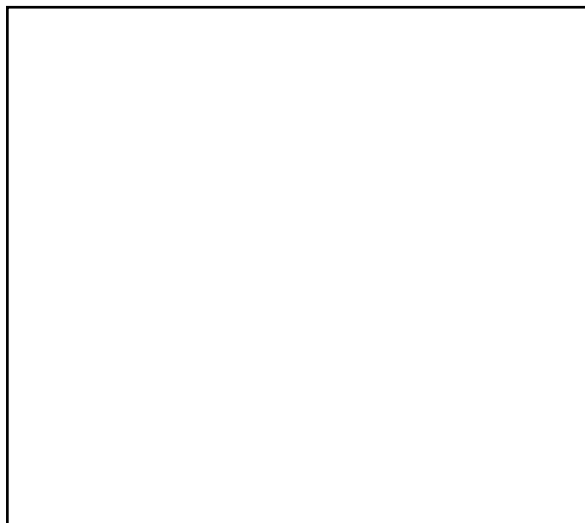
Figura 1 : Ênfases de capacitação docente em EAD

Consciente de que a nova arquitetura educativa, hoje apresentada como um desafio em EAD, envolve uma mudança radical não só nos modos como se ensina e como se aprende, mas também na maneira como se pensa o conhecimento, a PUCRS VIRTUAL organizou cursos de capacitação para professores nos quais são vivenciados processos relacionados à inserção no paradigma que constitui sua proposta para EAD, na apropriação tecnológica de mediações por computador e nas vias telecomunicacionais, além de investimentos no desenvolvimento de instrumentais vinculados às multimídias.